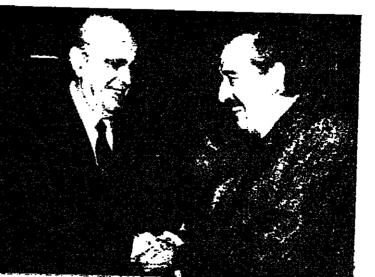
الرئيس اليوناني كوستاس كيريليس يرحب بالرئيس الأرجنتيني كارلوس مينديز

يختر راؤول الفونسين رئيس الأرجنتين وجوليوس نيريري رئيس تنزانيا وأندياس باينديرو رئيس وزراء اليونان وأوليف بالم رئيس وزراء السويد بالإضافة إلى خمسين شخصية أخرى من جميع أنحاء العالم مؤتمر المبادرة من أجل السلام في القارات الخمس، الذي يبدأ في اثينا اليوم الخميس.